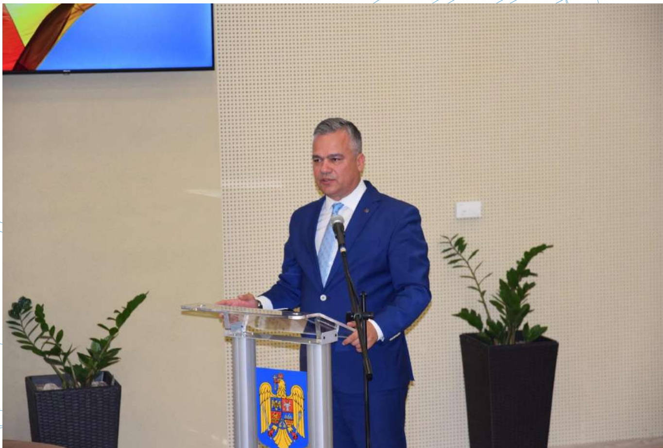
Adrian Veștea, ministrul Dezvoltării, Lucrărilor Publice și Administrației, vizită de lucru în județul Satu Mare – noiembrie 2023